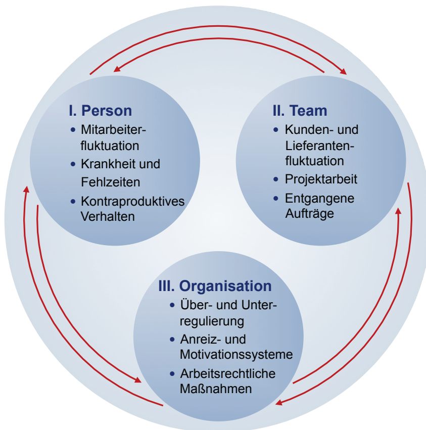
Konfliktkostenkategorien KPMG / Circle of Conflict

Als Antwort auf diese Frage wurde 2011 im Kreis der Unternehmerschaft Düsseldorf die Idee geboren, einen Erfahrungsaustausch zwischen Unternehmen zu initiieren, in dem Unternehmen gut gelöste Konflikte vorstellen und anschließend die entstandenen und ggf. auch ersparten Konfliktkosten transparent berechnet